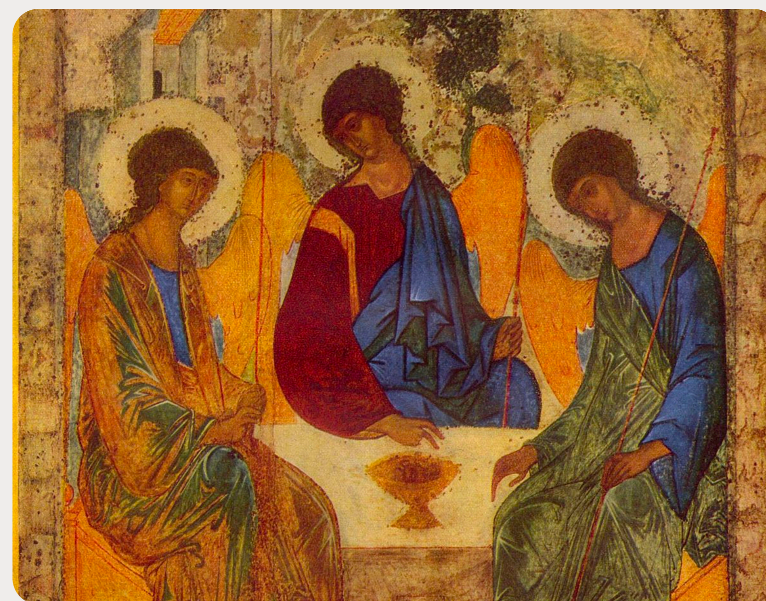
Икона Троицы преподобного Андрея Рублева

Праздник Святой Троицы призывает нас открыть сердца для действия Святого Духа, стремиться к добродетельной жизни, чтобы на опыте познать Бога и истинную любовь.