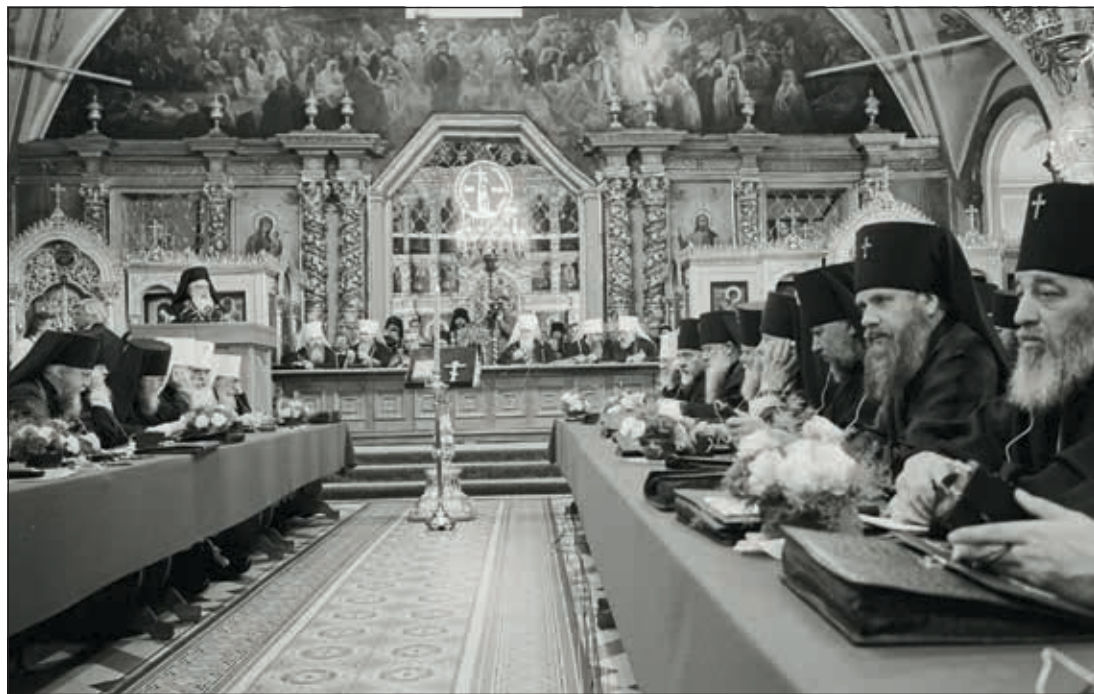
Трапезный храм Лавры. Заседание Поместного Собора Русской Православной Церкви, приуроченного к празднованию 1000-летия Крещения Руси. 6–9 июня 1988 года