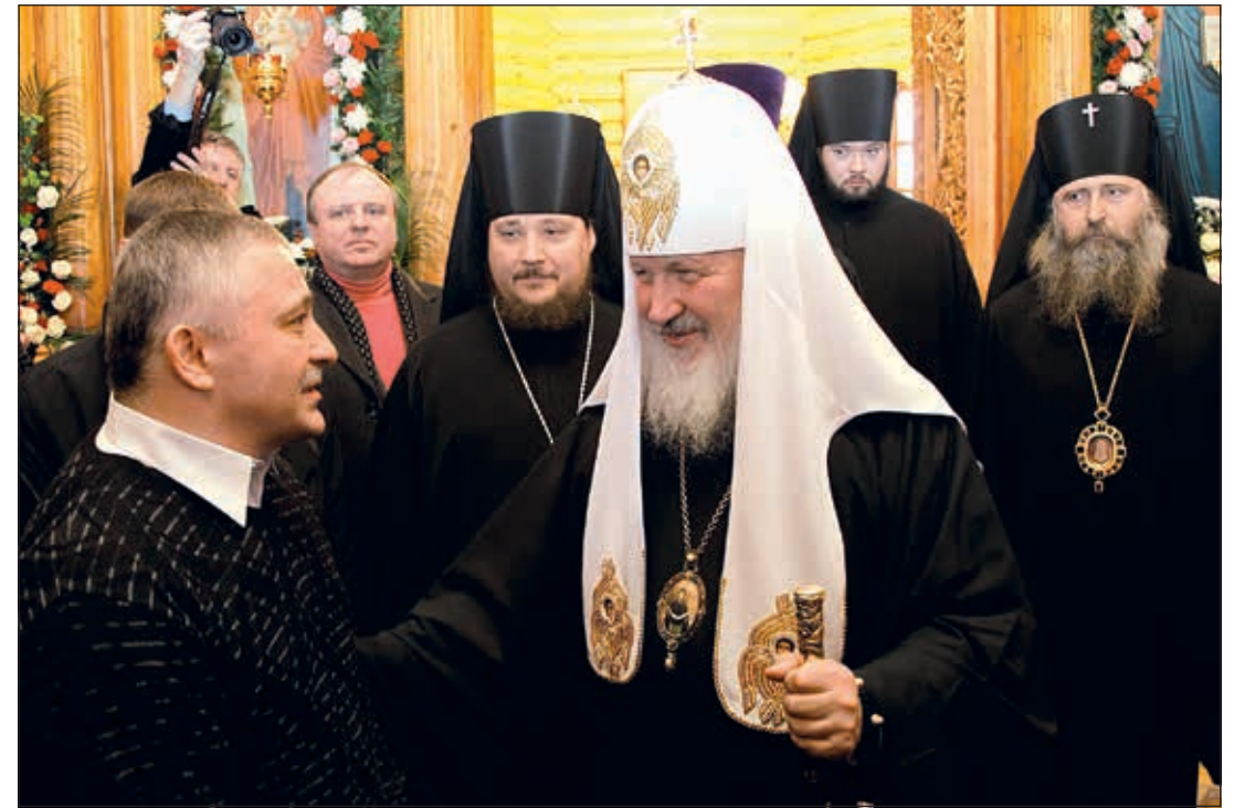
Святейший Патриарх Кирилл и Герой России космонавт Ф. Н. Юрчихин

С 2008 года согласно резолюции Святейшего Патриарха Алексия II храм Преображения Господня находится под духовным окормлением братии Свято-Троицкой Сергиевой Лавры. Позже Святейший Патриарх Кирилл подтвердил эту практику, отметив: «Полагаю важным сохранить традицию духовного окормления прихожан Патриаршего подворья при храме Преображения Господня в Звездном городке братией Свято-Троицкой Сергиевой Лавры» (Резолюция от 28 февраля 2022 г.).