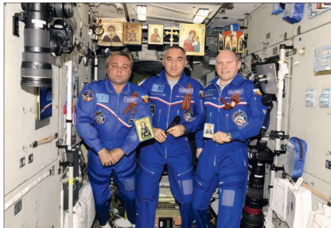
Космонавты Александр Скворцов, Максим Сураев и Олег Артёмьев (полет 28.05.2014–10.11.2014, космический корабль «Союз ТМА-13М»)

26 ноября 2010 г.), частицу мощей святого великомученика Георгия Победоносца (полет на космическом корабле «Союз ТМА-09М» с 29 мая по 11 ноября 2013 г.) и икону святителя Луки (Войно-Ясенецкого), которую потом передали в Новоспасский монастырь (полет на космическом корабле «Союз МС-04» с 20.04.2017, возвращение на Землю на спускаемом аппарате космического корабля «Союз МС-03» 2 июня 2017 г. с космонавтом Олегом Новицким).