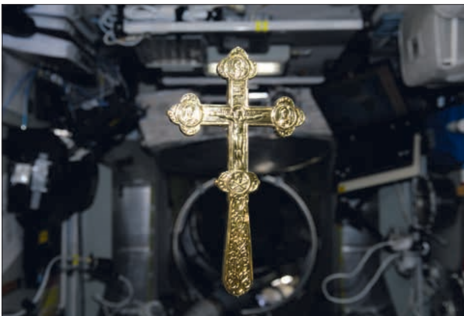
Крест — благословение Святейшего Патриарха Алексия II