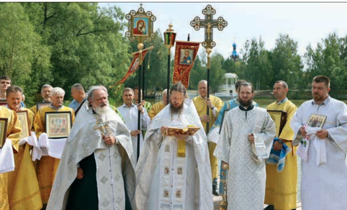
Крестный ход в Звездном городке на праздник Преображения Господня

человеку необходимо, где бы он ни находился — на Земле или в космосе, — прежде всего, научиться быть с Богом. Полеты в космос нужны в том числе и для того, чтобы, пытаясь постичь загадку мироздания, мы поняли, что Вселенная не могла возникнуть сама собой, без воли Творца; чтобы мы смогли познать самих себя, понять, кто мы такие, зачем созданы и как нам следует относиться к этому миру и его Творцу.