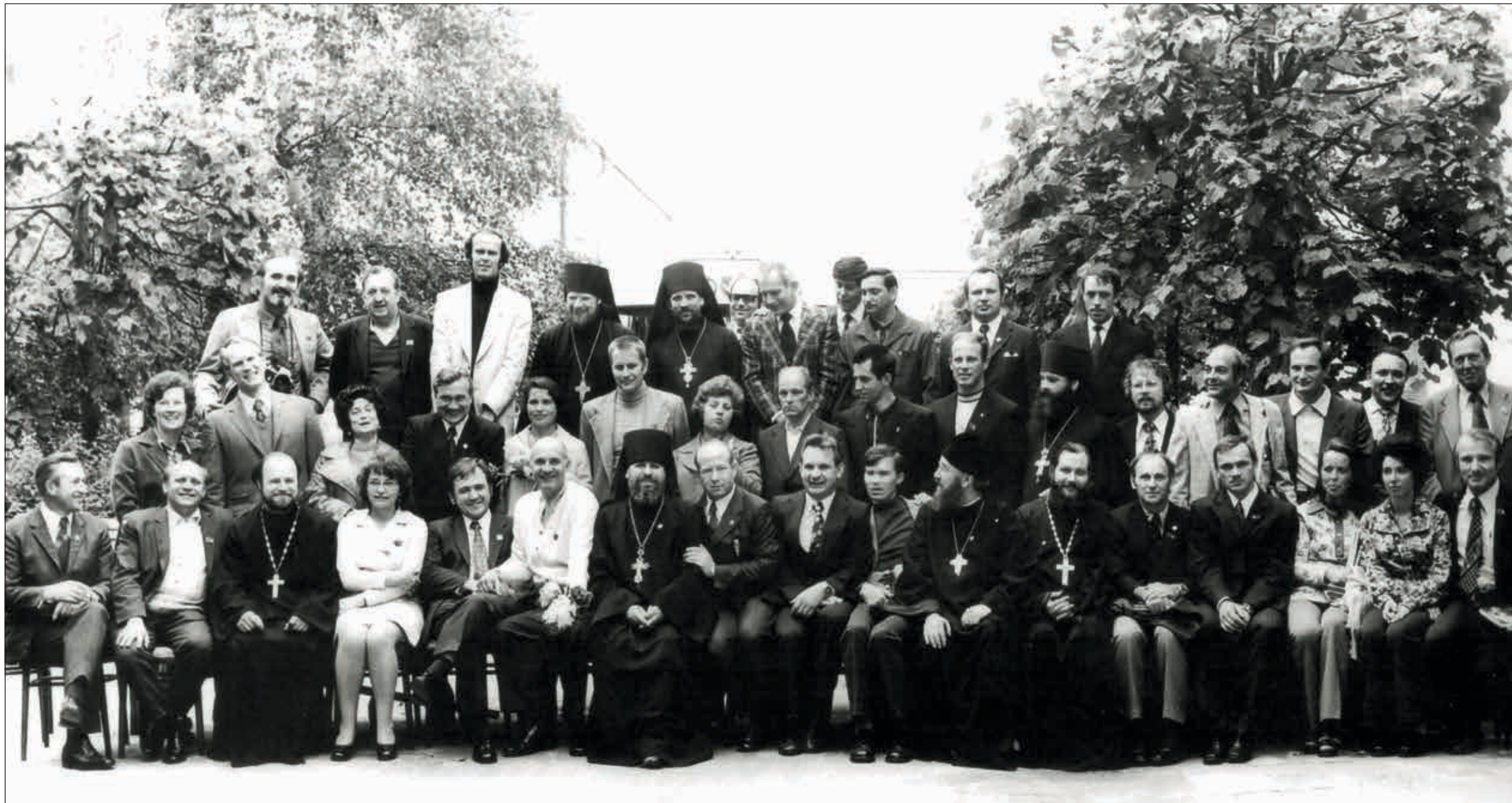
1975 год. Участники программы совместного экспериментального пилотируемого полета космических кораблей «Союз-19» и «Аполлон» космонавты Алексей Леонов, Валерий Кубасов и американские