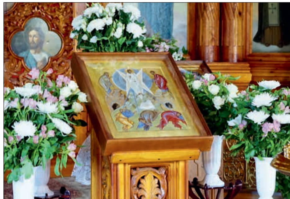
Храмовая икона Преображения Господня с камнем, привезенным с горы Фавор

молитвы за весь мир. Кроме того, они, как и в обычной жизни, помогают человеку жить и работать. Своей благодатной силой святыни освящают пространство космической станции, и кто знает, скольких аварий и просто неприятных моментов удалось избежать благодаря помощи Божией, заступничеству Пресвятой Богородицы и святых... Мы знаем, что во время эпидемий, войн, междоусобиц или, наоборот, в дни праздников и памятных событий люди идут крестным ходом с иконами и молитвой, каждый со своим чаянием, радостью или бедой. Не только космонавты берут святыни в космос. Подводники тоже не погружаются без святыни на своем корабле. Известны случаи,