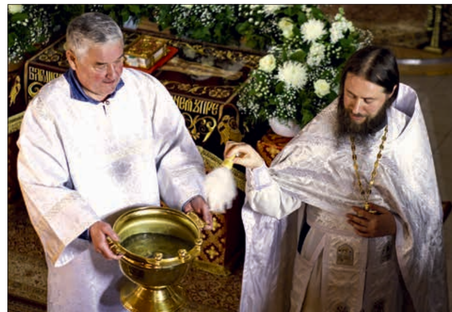
Староста храма космонавт В. Г. Корзун и настоятель храма иеромонах Пафнутий (Фокин)

проводы и встречи космонавтов; поездки в Свято-Троицкую Сергиеву Лавру с молебном у мощей Преподобного для членов экипажа накануне отъезда на Байконур. Особое внимание уделяется окормлению космонавтов и их семей. Для поддержки космонавтов на орбите осуществляются сеансы связи по штатному каналу, когда они могут пообщаться со священником и с прихожанами. По большим праздникам организуется видеоконференция космонавтов с Предстоятелем Русской Православной Церкви. Родственники космонавтов в ожидании возвращения своих близких всегда могут прийти в церковь, помолиться и получить утешение. Такая поддержка очень важна, ведь