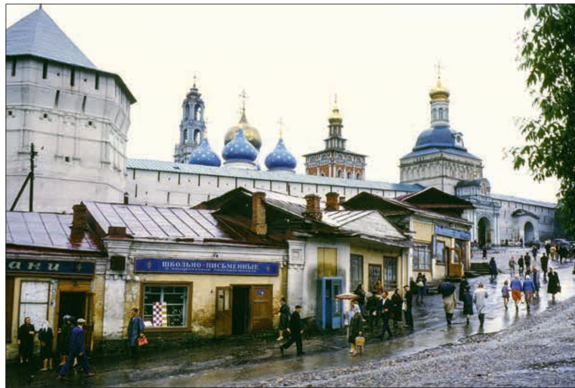
У стен Троице-Сергиевой Лавры. 1960-е годы

Во время этой поездки Юрий Гагарин увидел в Церковно-археологическом кабинете Московской духовной академии макет Храма Христа Спасителя. Впечатления от посещения Лавры привели к тому, что, выступая