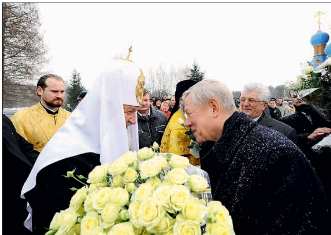
Руководитель Роскосмоса А. Н. Перминов берет благословение у Святейшего Патриарха Кирилла