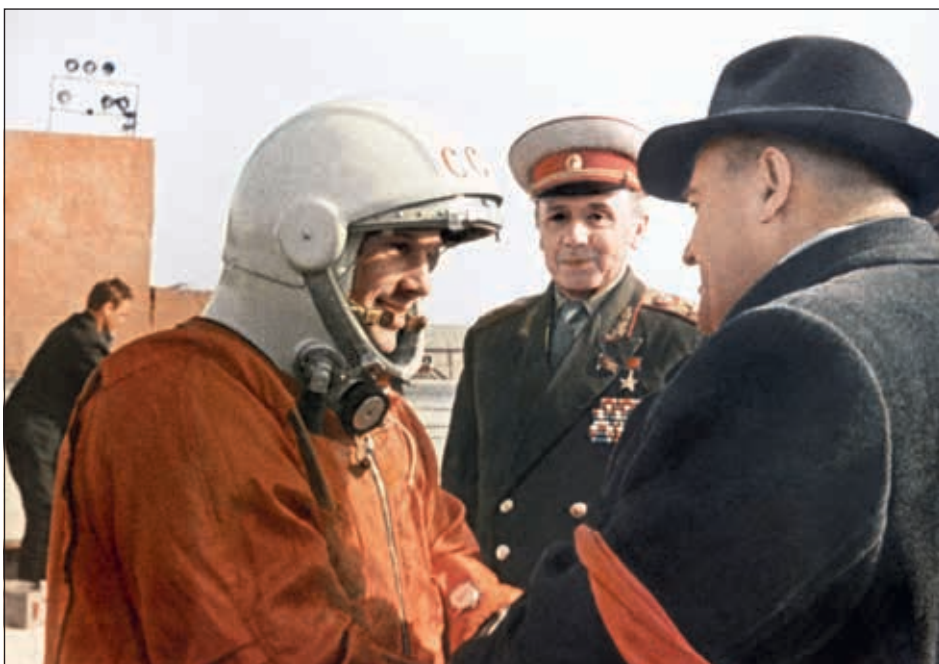
Последние напутствия главного конструктора Сергея Павловича Королева Юрию Гагарину перед стартом

велась атеистическая пропаганда. И все-таки почти все космонавты первого отряда были людьми крещеными.